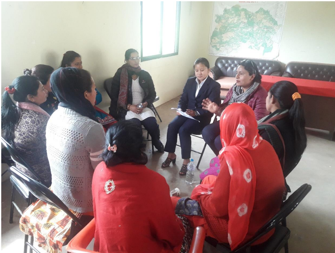
लक्षित समुह छलफलको केही भलकहरु